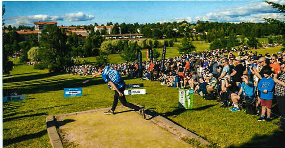
Crowds extend down the fairway at the European Open in Nokia, Finland.

The United States may have jumped out to a big lead in the disc golf market, but the rest of the world is quickly catching up.