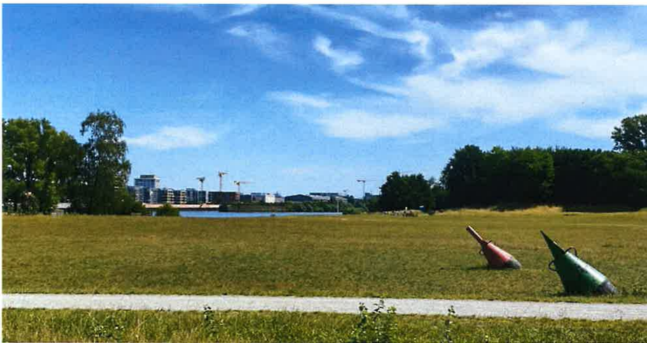
Bremen Weserufer-Discgolf-Park in Germany.

Discover the best places to play disc golf in Germany with UDisc Places.